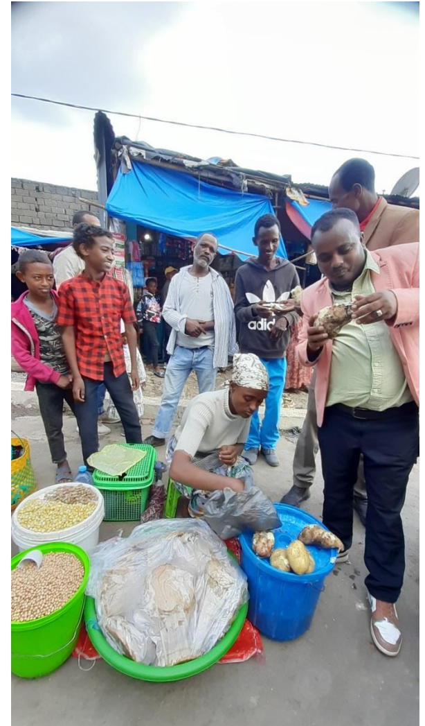
고구마, 빵 등을 만 들어 저녁에 거리 에 나와 파는 여성